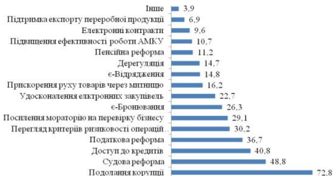
Рис. 3. Пріоритети уряду в умовах зовнішніх викликів для збільшення прибутковості підприємств, % [9]