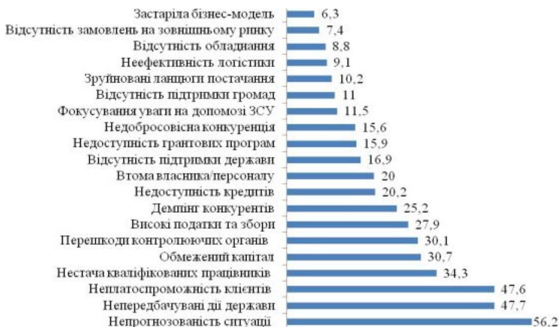
Рис. 2. Зовнішні та внутрішні фактори, які впливають на прибутковість підприємств в 2023 році, % [9]