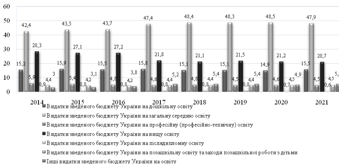
Рис. 2. Структура щорічних видатків зведеного бюджету України в розрізі рівнів освіти за період 2014–2021 рр., %

Фінансування освіти в Україні відбувається за наступними складниками системи освіти – дошкільна, повна загальна середня, професійна (професійно-технічна), вища, післядипломна, позашкільна [2]. Професійна (професійно-технічна) освіта є складовою системи освіти України. Заклад професійної (професійно-технічної) освіти утворюється відповідно до соціально-економічних потреб держави чи окремого регіону [4]. Структуру щорічних видатків зведеного бюджету України в розрізі рівнів освіти представлено на рис. 2.