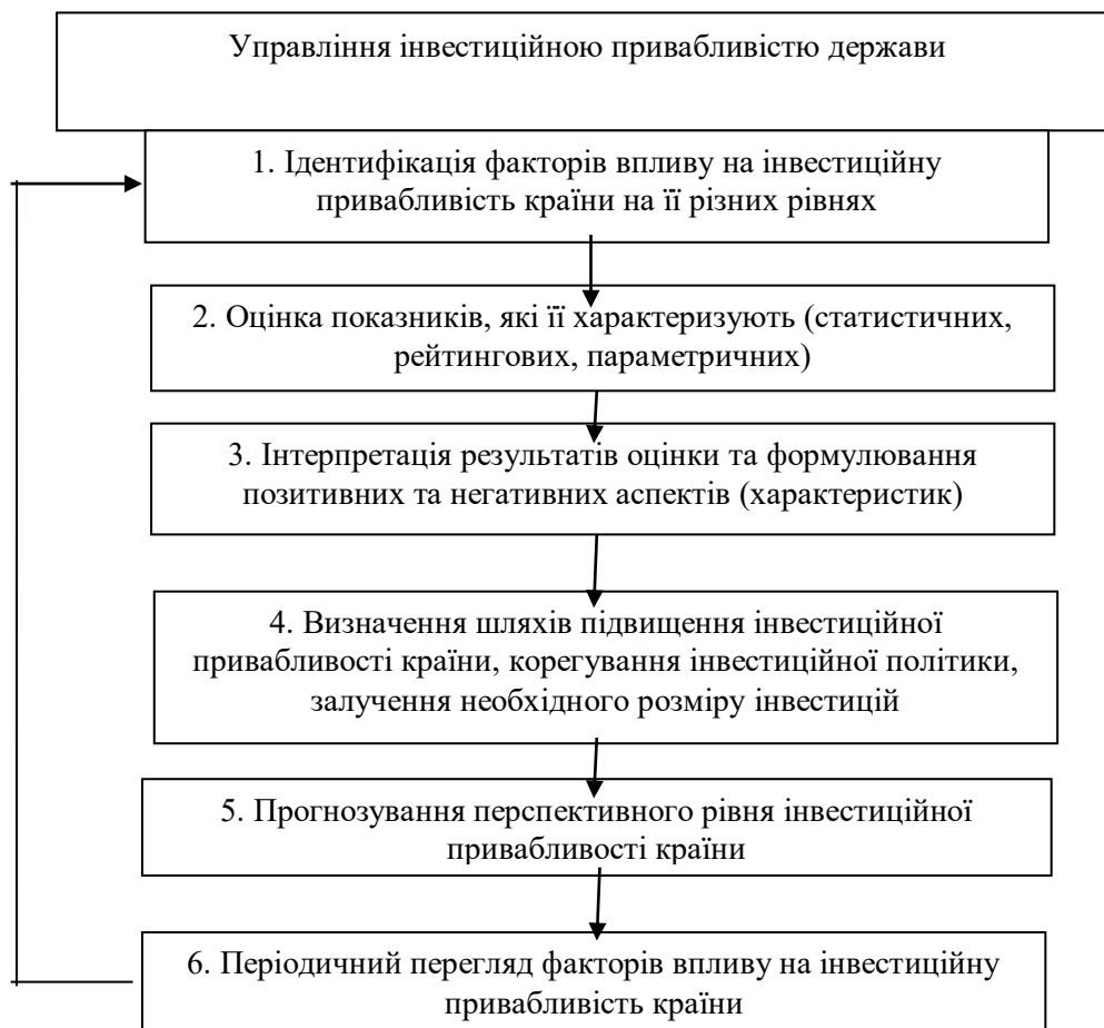
Рис. 2. Схема процесу управління інвестиційною привабливістю держави

позитивних та негативних аспектів (характеристик); визначення шляхів підвищення інвестиційної привабливості країни та залучення необхідного розміру інвестиційного капіталу; прогнозування перспективного рівня інвестиційної привабливості країни, періодичний перегляд факторів (рис. 2).