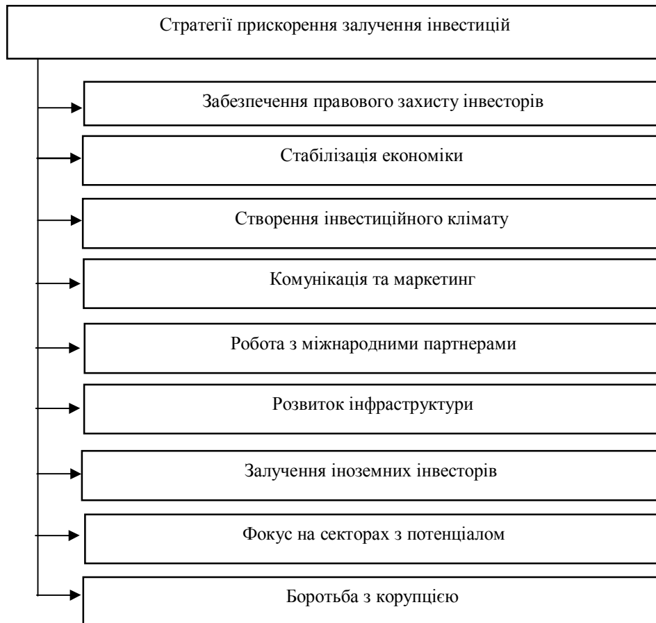
Рис. 1. Стратегії прискорення залучення інвестицій в Україну

На рис. 1 наведено основні стратегії прискорення залучення інвестицій в економіку країни. Кожна із виокремлених стратегій повинна включати конкретні механізми та програми реалізації, в тому числі із використанням сучасних цифрових технологій.