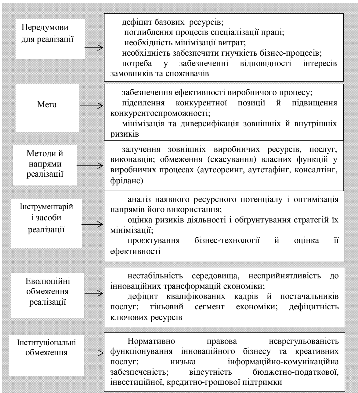
Рис. 1. Структурно-логічна схема функціонування інноваційного бізнесу

Низький рівень фінансової та інституціональної спроможності держави не сприяють мобілізацію наявних ресурсів і наукового потенціалу для розвитку й підтримки фундаментальної науки як бази інноваційних перетворень, що виявляється на мікроекономічному рівні у низькій частці інноваційно активних товаровиробників, а на макроекономічному – у критично низькому рівні наукоємності ВВП.