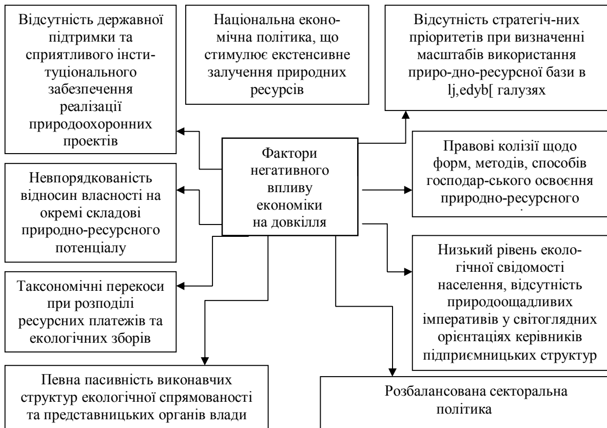
Рис. 2. Фактори негативного впливу національної економіки на природне середовище