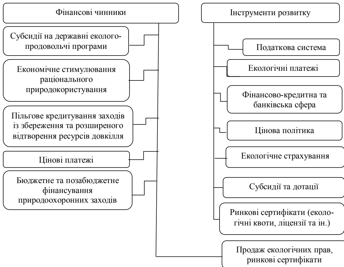
Рис. 1. Фінансові чинники та інструменти розвитку інвайроментального менеджменту

В інвайроментальному менеджменті доцільно виділити такі функціональні блоки: ресурсовикористання; конструктивну трансформацію природних ресурсів з виробничого використання у заповідні території; розширене відтворення природно-ресурсного потенціалу; збереження (просте відтворення) природних ресурсів; управління якістю довкілля економічними (непрямими) методами; екологічний моніторинг. За сутністю інвайроментальний менеджмент вивчає економічні методи управління природними умовами середовища мешкання людини у паритеті з екологічними та соціальними складовими.